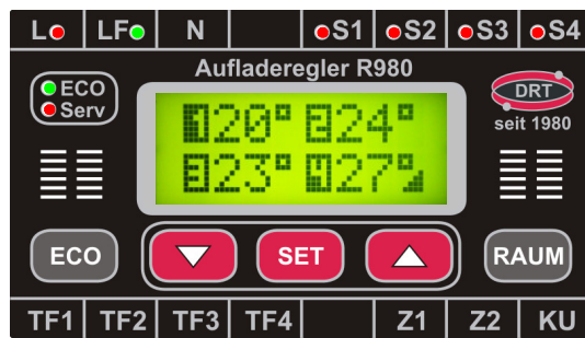
Aufladeregler R980-2 /-3 /-4